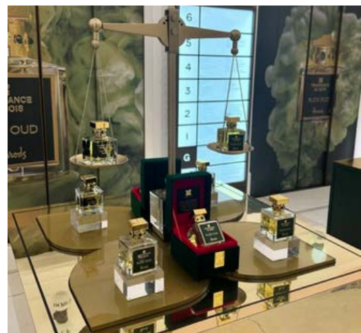
RUDE OUD BY FRAGRANCE DU BOIS

El evento concluyó con una animada sesión de preguntas y respuestas, permitiendo a los clientes sumergirse completamente en la experiencia de la fragancia.