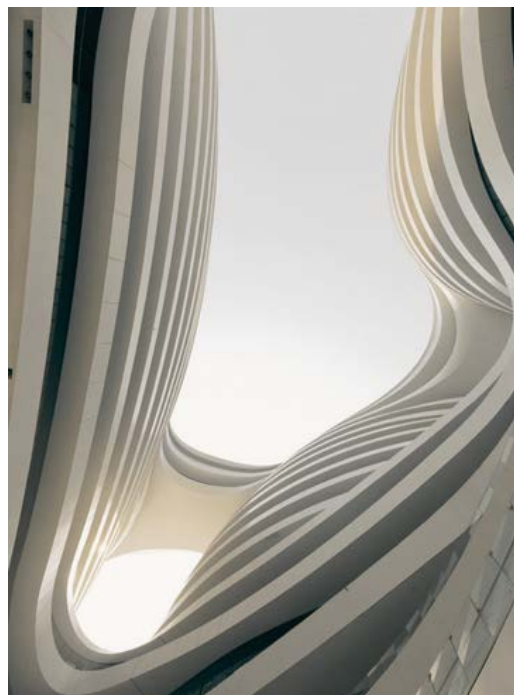
REFERENCIA DE ARQUITECTOS DECONSTRUCTIVISTAS - ZAHA HADID